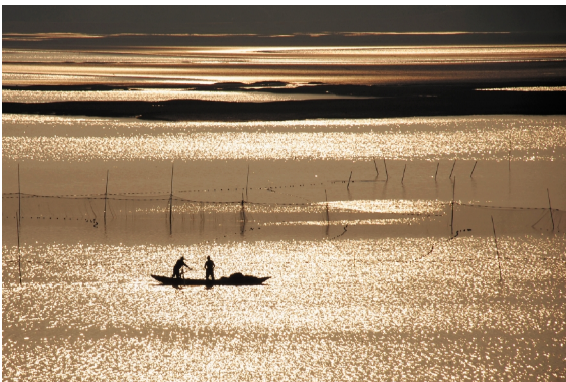
《渔舟——傍晚的洋沙湖》