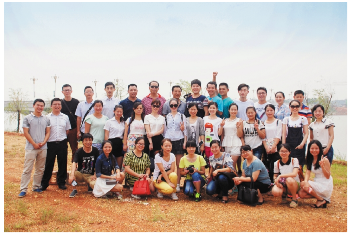
《顺天报》通讯员参观洋沙湖项目建设现场合影