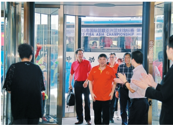
酒店热烈欢迎宫鲁鸣总教练率中国男篮队员下榻