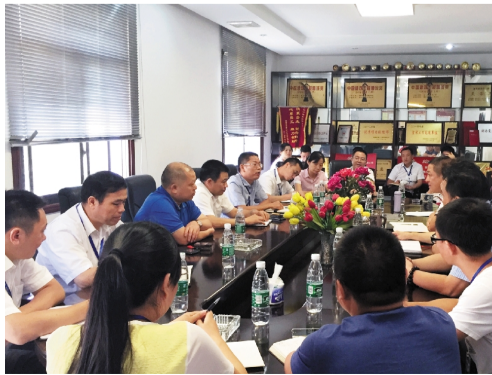
交流学习会议现场