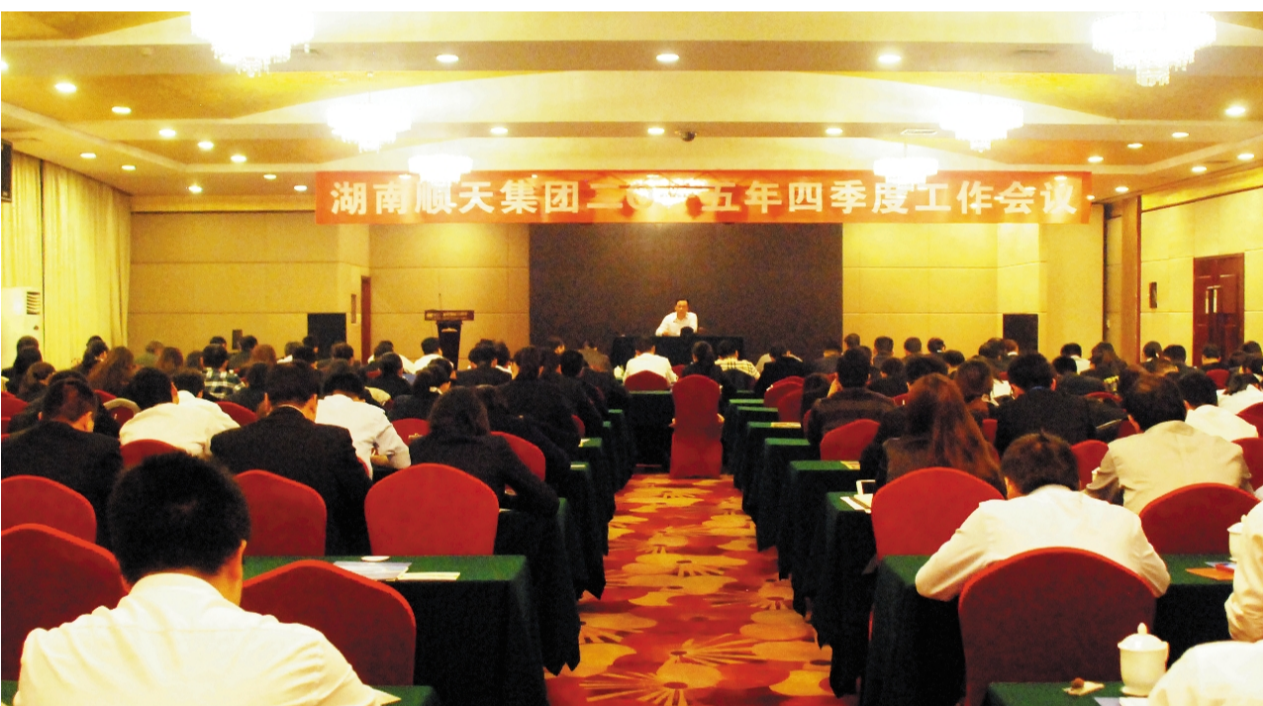
湖南顺天集团2015年四季度工作会议

房产公司怎样在最后交一个圆满的答案？一是集中力量，二是从整体的管理上加强，三是在御岭项目的管理上作为总监要运作到位。销售也好，策划也好，现场管理也好，整体方案也好，要尽快地把它们组织起来，还要更加进一步地完善各项制度，有很多问题是发现了的，还不吸取教训，还不采取措施。营销上怎么发力，管理规范上怎么发力，御岭项目上怎么发力，每件事都要做到心里有数。